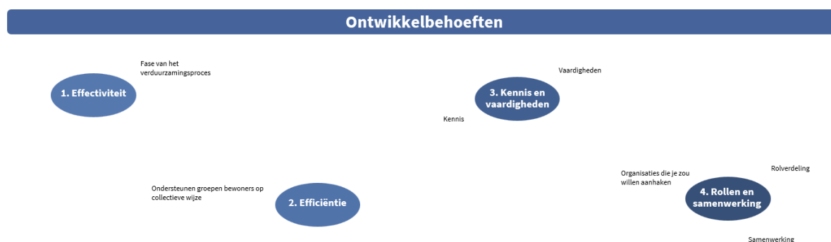
Afbeelding 2: Deel van het werkblad waarop ontwikkelbehoeften in kaart worden gebracht