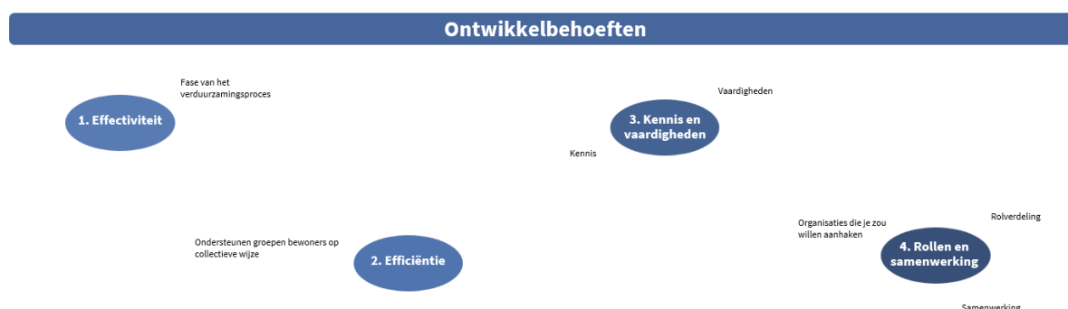
Afbeelding 2: Deel van het werkblad waarop ontwikkelbehoeften in kaart worden gebracht